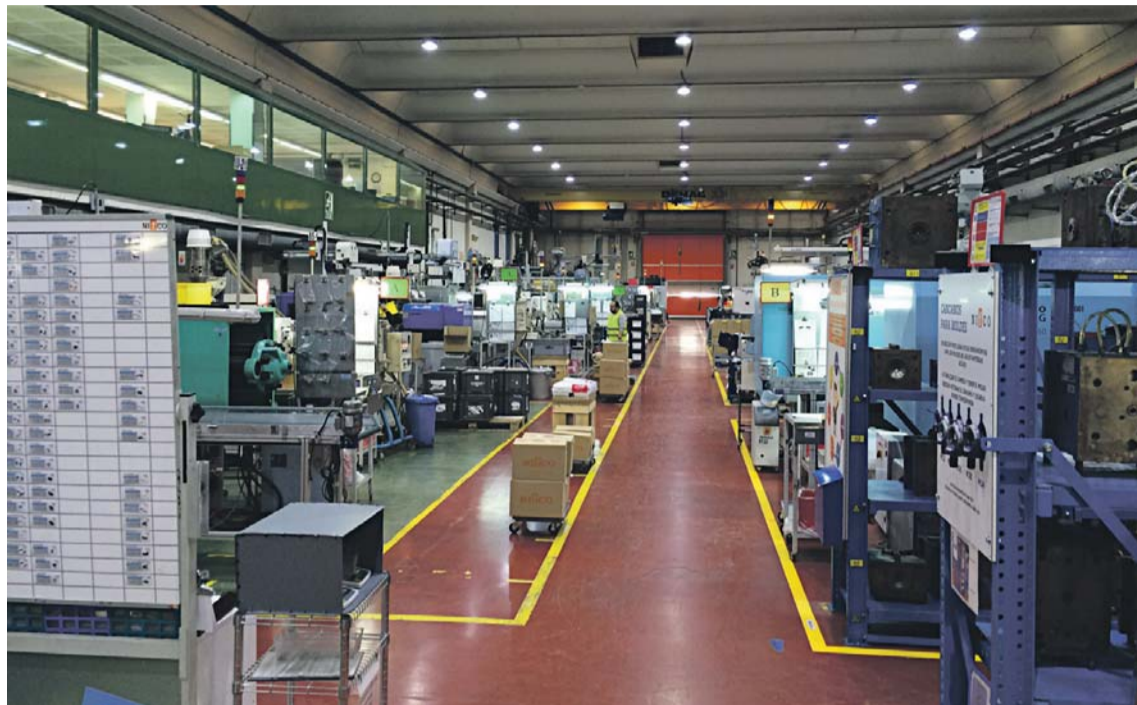
Sede española de la multinacional japonesa Nifco, situada en Terrassa.

Los contratos logrados supondrán la construcción de piezas de exterior para los vehículos, como triángulos, corbatas y trapecios, o de sujeción -brackets- que supondrán unos ingresos de 27,5 millones para la división española de